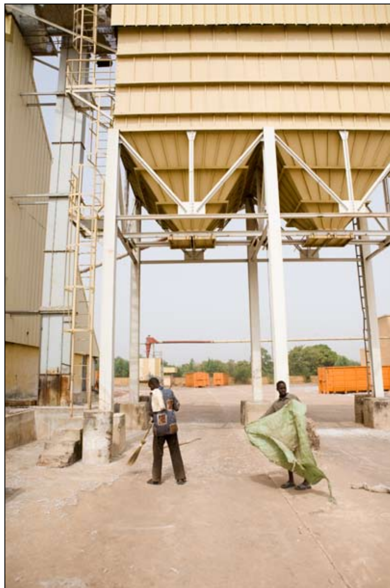
Travailleurs journaliers du coton, Nettoyage de l'usine - Usine d'égrenage de Bougouni