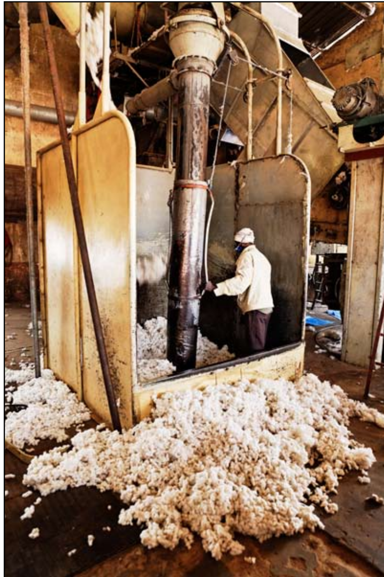
Travailleur lors de l'aspiration du coton